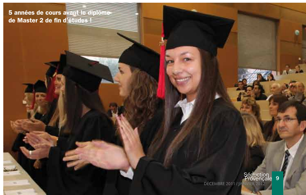
5 années de cours avant le diplôme de Master 2 de fin d'études !