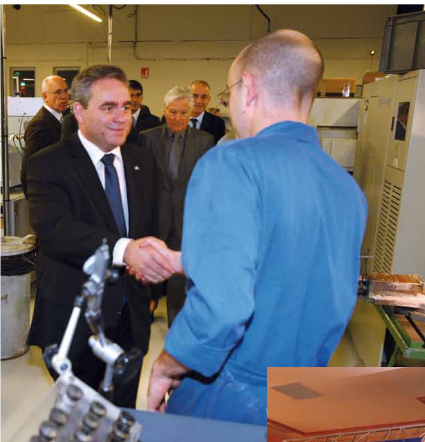
▲ Samedi 4 novembre : visite à Draguignan dans les locaux de la société SOMMEPP, notamment fabricant de moules pour cosmétiques, du Ministre du Travail et des Affaires Sociales, Xavier Bertrand. Une entreprise située ZA St Hermentaire durement touchée par les inondations de 2010, mais qui a su maintenir un haut niveau de savoir-faire en précision mécanique.