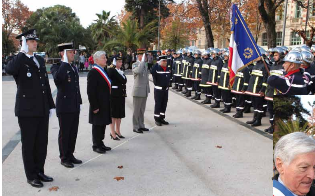
▲ Samedi 3 décembre : la cérémonie de la Sainte-barbe des Sapeurs-Pompiers au jardin Anglès, au cours de laquelle le Maire et les autorités locales ont décoré des "soldats du feu" particulièrement méritants.